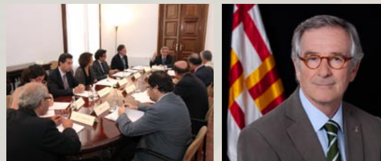
Tercera sessió plenària de la Comissió d'Estratègia, presidida per l'alcalde de Barcelona (11 de juliol, Ajuntament de Barcelona)

El PEMB participa en la Taula Barcelona Creixement