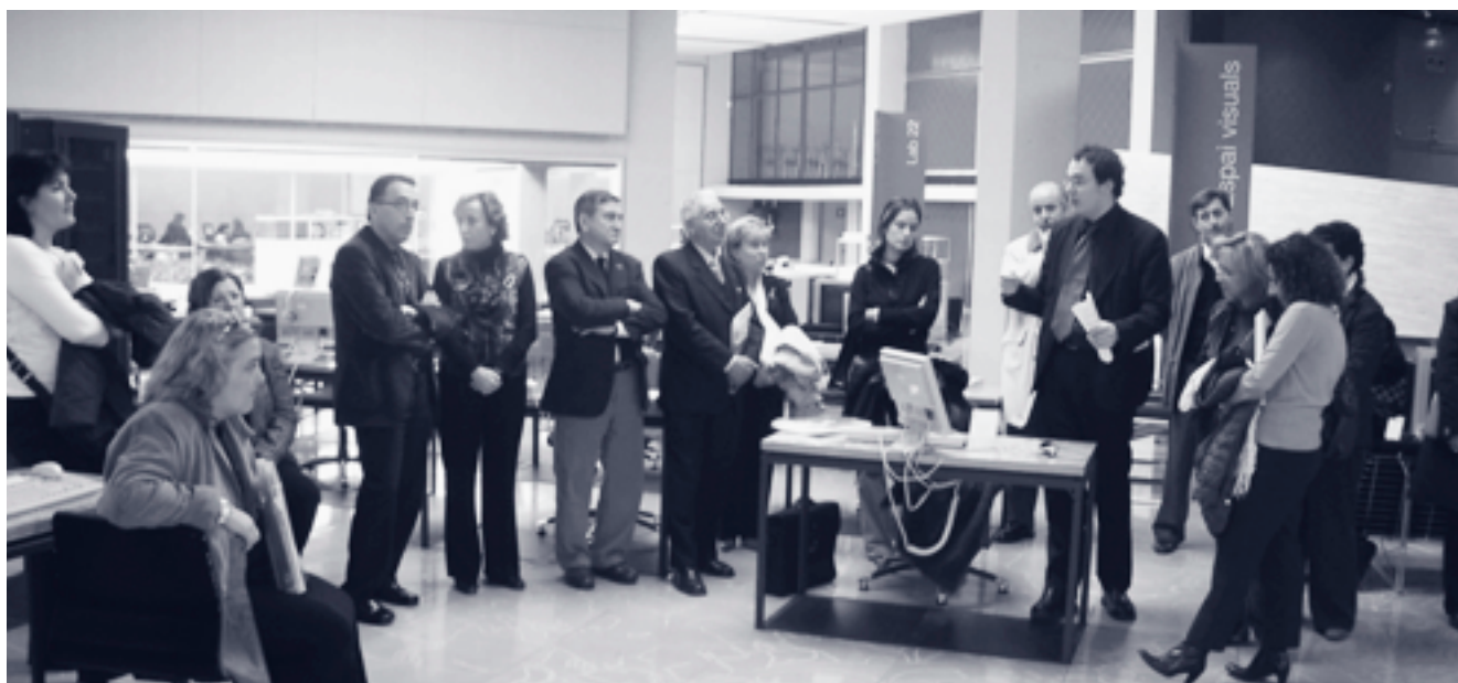
Visita a les instal·lacions de Barcelona Activa (1 de març del 2006)

programes d'ocupació, innovació, formació i assessorament que s'estan portant a terme actualment. A continuació, els assistents van visitar dues de les propostes més importants de Barcelona Activa: l'edifici del Viver d'Empreses i l'espai Porta22, dedicat a la informació i orientació sobre les ocupacions de futur. La visita va finalitzar amb un dinar de treball.