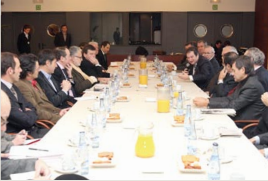
12 de gener, Museu Picasso