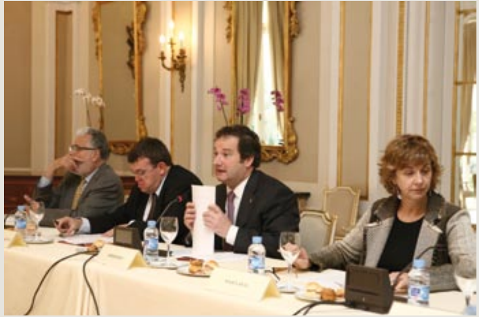
7 de maig, Palauet Albéniz