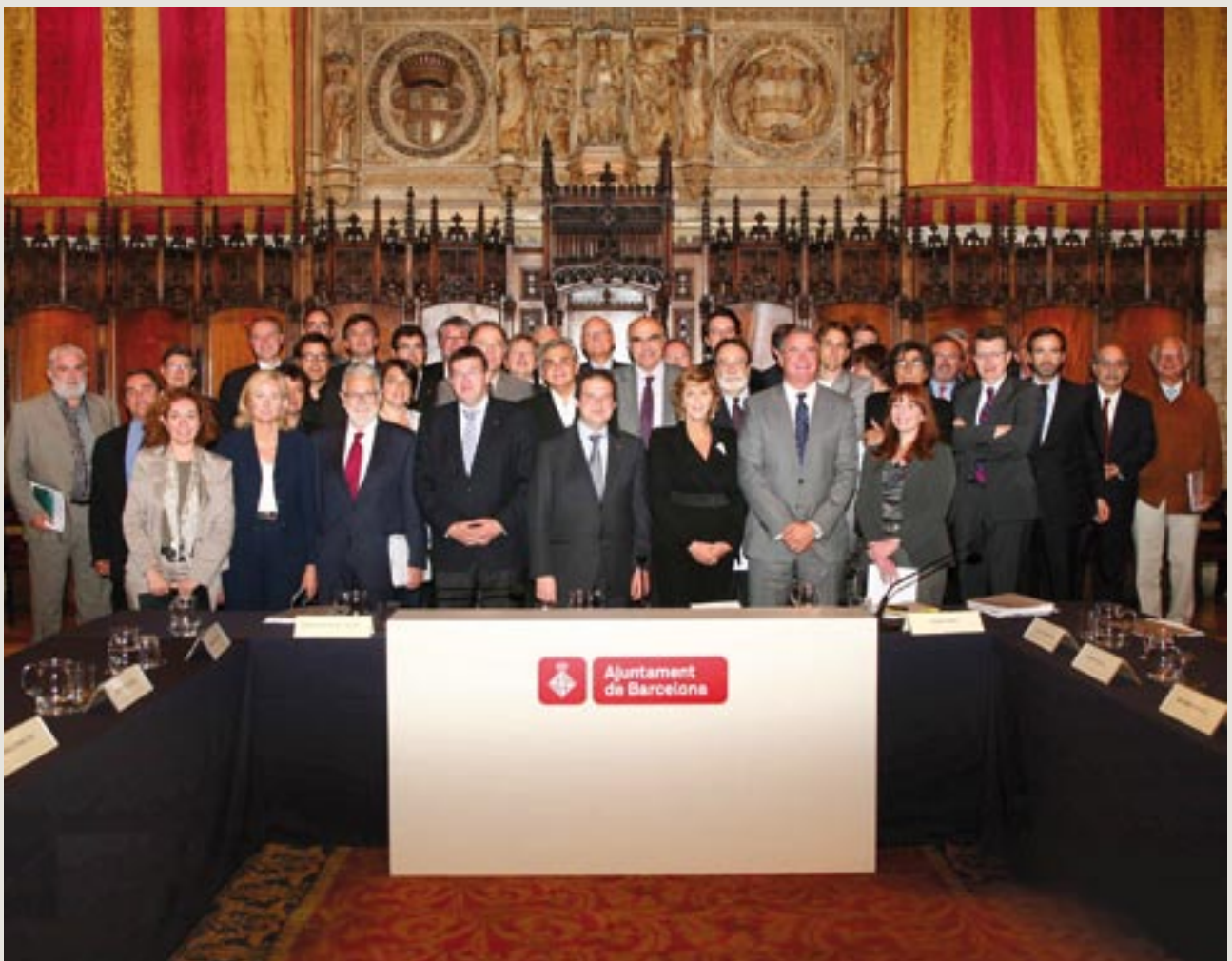
Acte de presentació de les conclusions de la Comissió de Prospectiva (26 de maig, Saló de Cent)