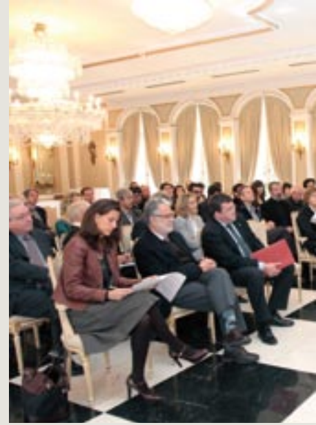
13 d'abril, Palauet Albéniz