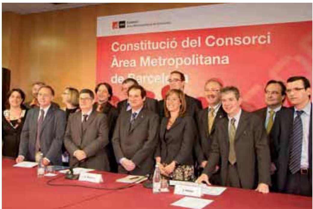
Acte de constitució del Consorci de l'AMB

Les tres institucions que actualment formen part del consorci són la Mancomunitat de Municipis de l'Àrea Metropolitana de Barcelona (MMAMB), l'Entitat Metropolitana del Transport (EMT) i l'Entitat Metropolitana del Medi Ambient (EMMA). Es preveu, però, que més endavant s'hi puguin incorporar altres entitats o empreses públiques.