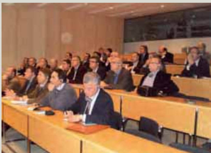
Jornades de treball de la delegació del PEMB a Hèlsinki i vista de la ciutat.