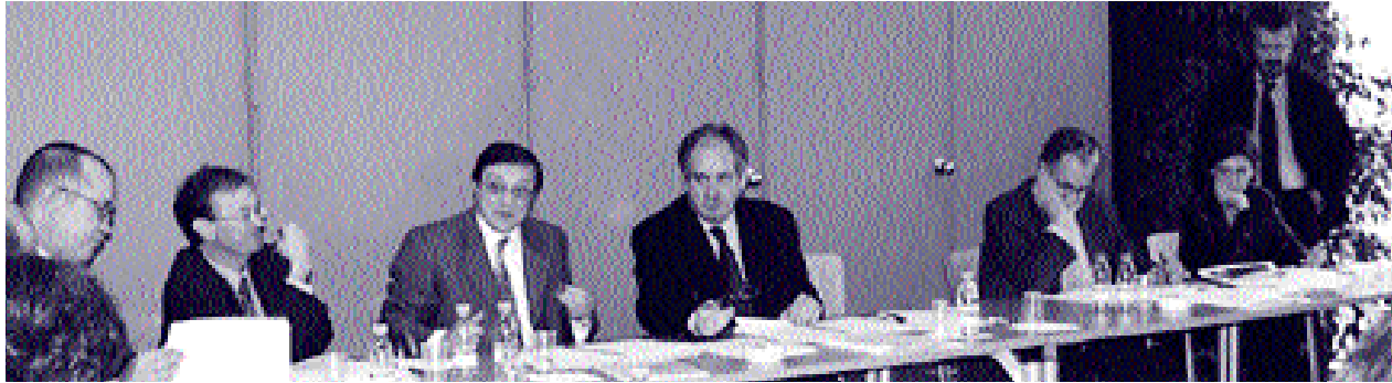
Durant la reunió es van marcar els temes que tractarà el Pla